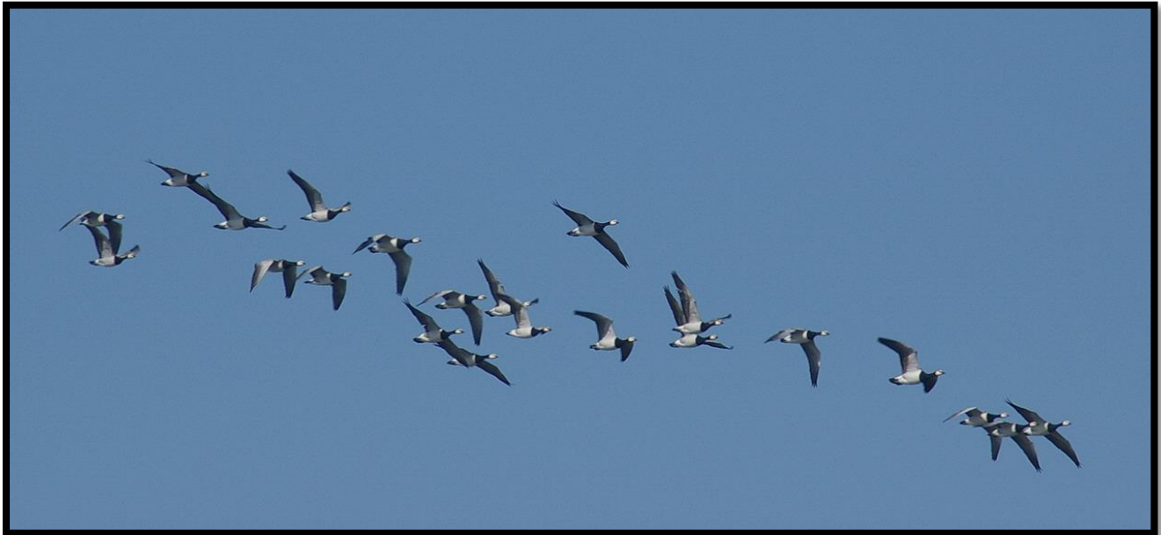
Bramgæs over Dybsø