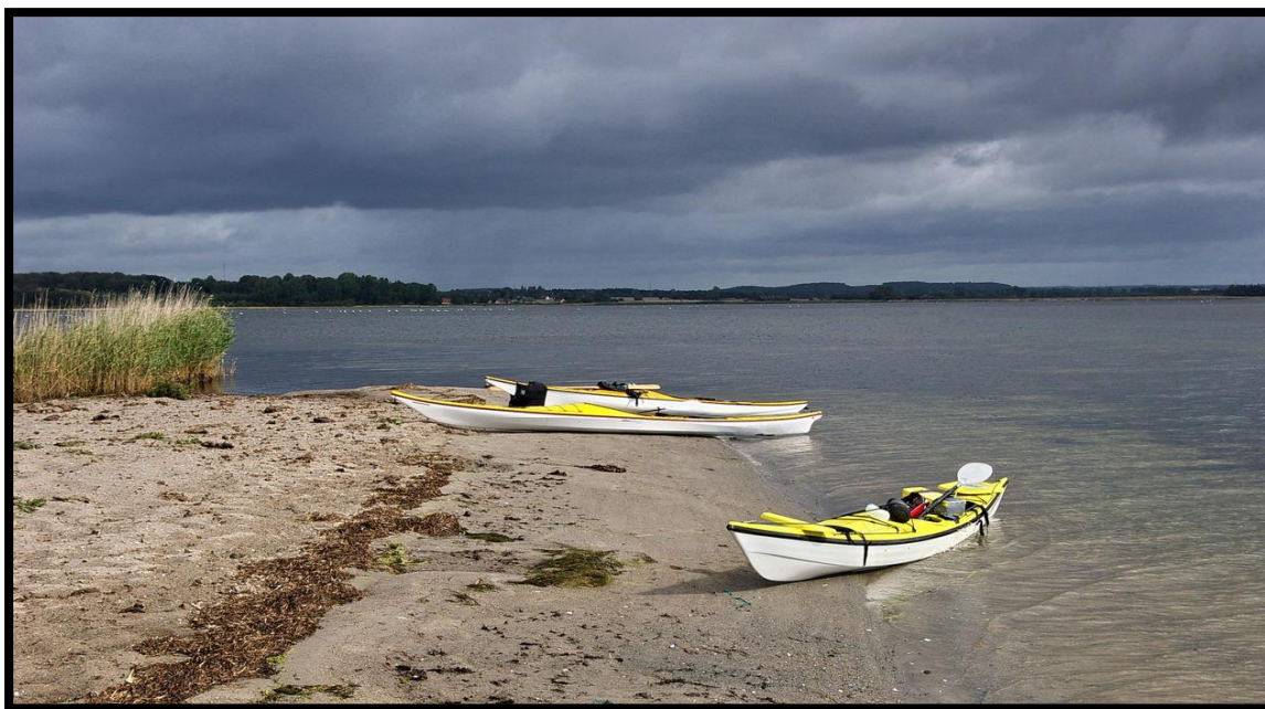
Karlsgab - Gavnø

Tilmelding: Senest 19. juni på mail info@naturogfriluftscener.dk med oplysning om medlemsnr.